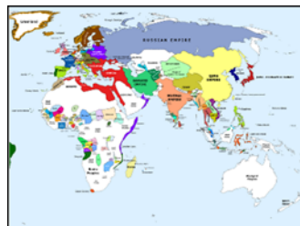
一張地圖 yì zhāng dì tú