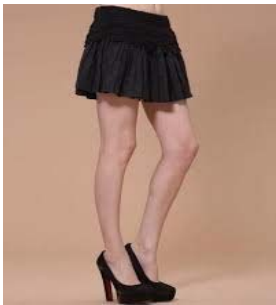
一雙腿 yì shuāng tuǐ