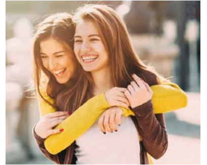
一位閨蜜 yí wèi guī mì