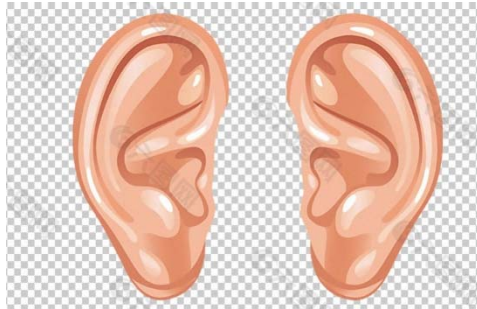
一對耳朵 yì duì ěr duǒ