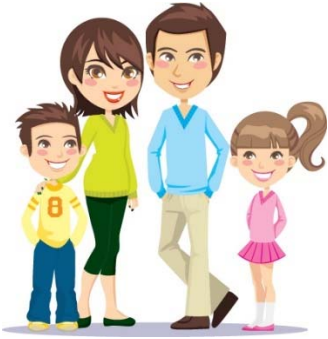
四位家人 sì wèi jiā rén