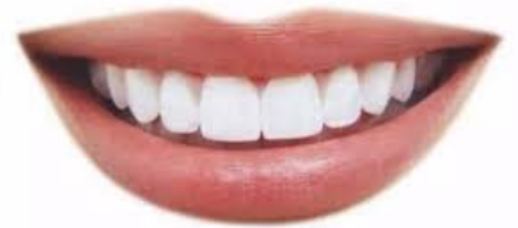
一排牙齒 yì pái yá chǐ