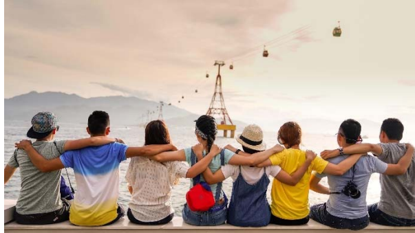
一群朋友 yì qún péng yǒu