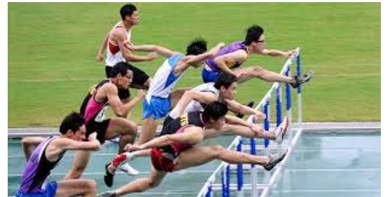
一項比賽 yì xiàng bǐ sài