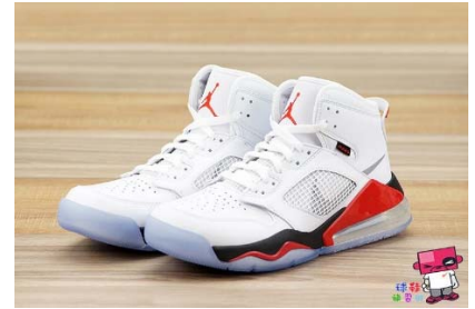
一 雙 球 鞋 yī shuāng qiú xié