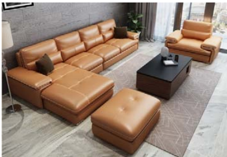
一 組 沙 發 yī zǔ shā fā