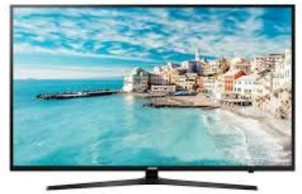
一 台 電 視 yī tái diàn shì