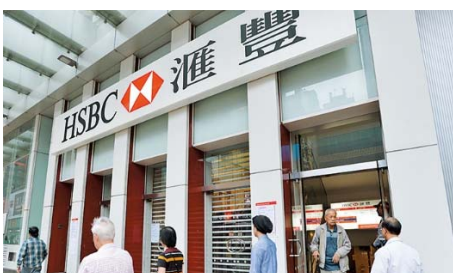
一 家 銀 行 yī jiā yín xíng