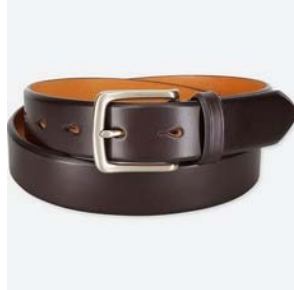
一 條 皮 帶 yī tiáo pí dài