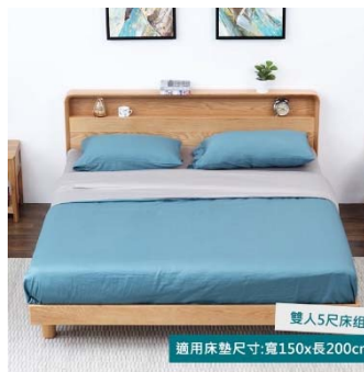
一 張 床 yī zhāng chuáng