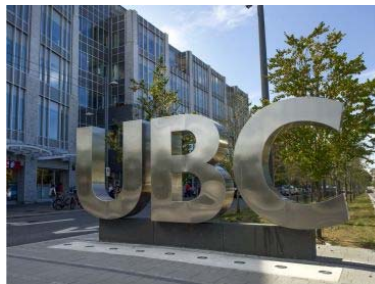
一 所 大 學 yī suǒ dà xué