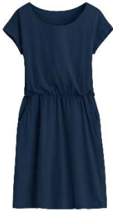
一 件 洋 裝 yī jiàn yáng zhuāng